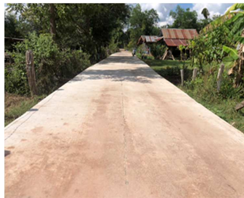
โครงการก่อสร้างถนนคอนกรีตเสริมเหล็กเส้นบ้านนางไลออน กระแสโสม ไปลานตากข้าวหนองน้ำ บ้านโคก อารักษ์ หมู่ที่ ๗